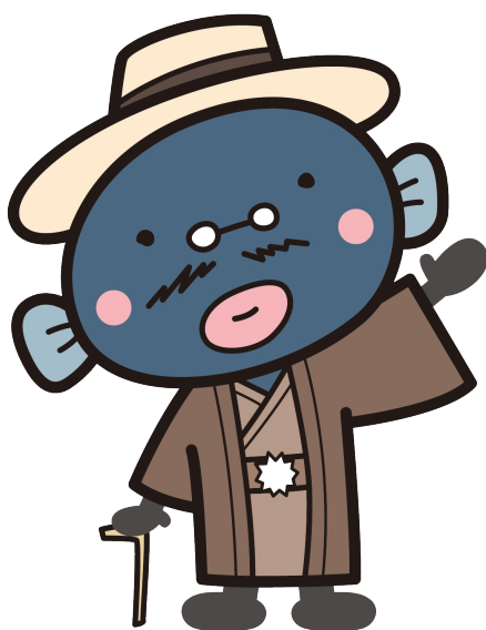
我孫子市マスコットキャラクター 手賀沼のうなぎちゃん

市では、昭和56年5月以前の旧耐震基準により設計・建築された木造住宅で、耐震性がない住宅を耐震改修工事実施したときに、その費用の一部を助成します。