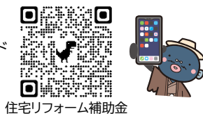
住宅リフォーム補助金