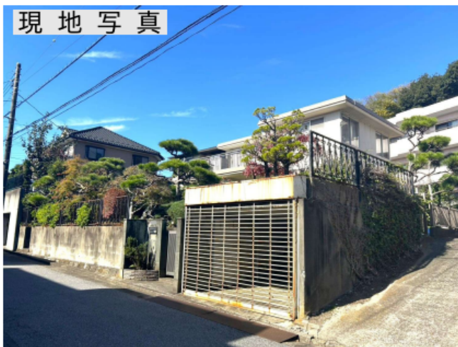
ライフインフォメーション