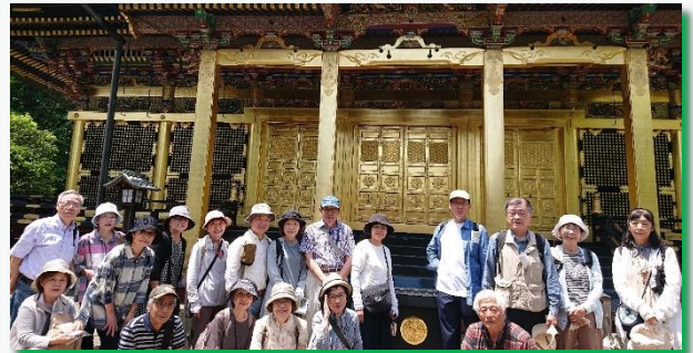
5月18日 上野東照宮にて