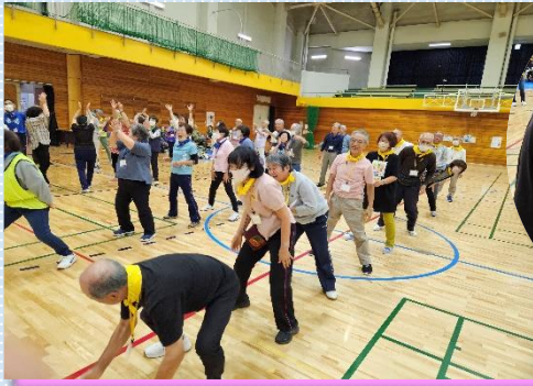
「帰って来いよ～」での笑顔