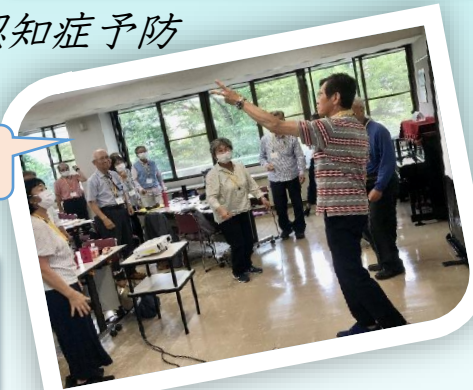
情感を思い浮かべ音感を感じながら声を出します こんなに真面目に声を出したのは初めてでした