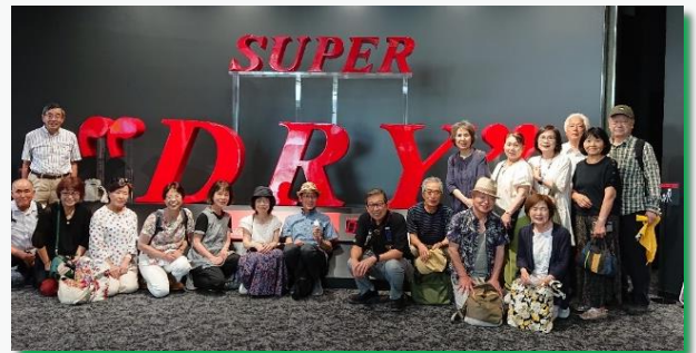
7月13日 守谷アサヒビール工場ミュージアムにて

散策しながらも、皆で一緒にワイワイ・ガヤガヤ会話や食事を楽しみ、且つ未知の歴史の一コマや文化財を探ってみませんか。