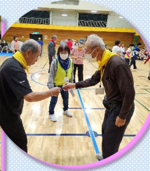
「おったまげー」での真剣な顔