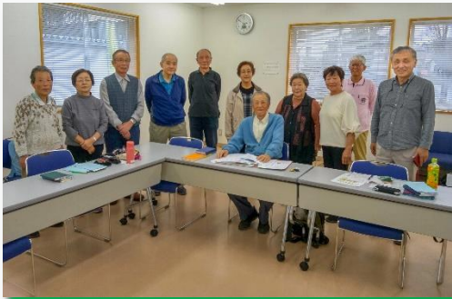
例会模様(OBの方々を含め活動しています)

詩吟は漢詩、俳句等を独特の節回しで大きな声で吟じます。腹式呼吸で歌うため、健康に良いとされています。我々も長寿大学入学後に詩吟を習い始めたものばかりです。皆さんの入部をお待ちしています。