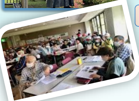
可愛いお客様と一緒に歴史を学び郷土愛を深めました