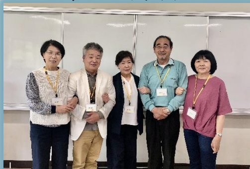
各委員を選出し今年の体制を作りました