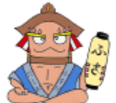
布佐地区キャラクター 「ふさだ だしお」