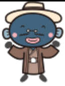
我孫子市マスコットキャラクター 「手賀沼のうなぎちゃん」

令和元年9月25日 我孫子市小中一貫教育だより 第217号 我孫子市教育委員会 小中一貫教育推進室