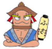
布佐地区キャラクター 「ふさだ だしお」