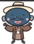
我孫子市マスコットキャラクター 「手賀沼のうなぎちゃん」

令和元年6月17日 我孫子市小中一貫教育だより 第212号 我孫子市教育委員会 小中一貫教育推進室