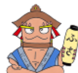
布佐地区キャラクター 「ふさだ だしお」