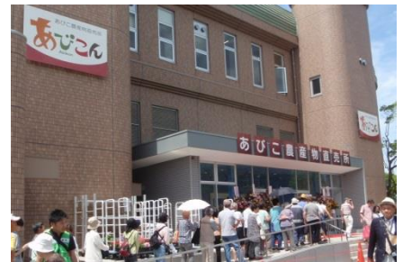
オープン時の様子

また、以前から手賀沼親水広場の利用者から声があった飲食施設として「 しゅんさいちゅうぼうまいまいてい 旬菜厨房米舞亭」が同じく1階にオープンしました。米舞亭では、我孫子市の「お米」と野菜を使用した和と健康をテーマにしたメニューを取り揃えています。屋外にはオープンデッキがあり、手賀沼を望みながらの飲食をお楽しみいただけます。店内は直売所にお買い物に来たご夫婦や親水広場に遊びに来た親子、女子会などで賑わっています。ちなみに、オープンから不動の1番人気メニューは、ミニサラダが付いた「野菜カレー」(600円)です。ぜひご賞味ください。