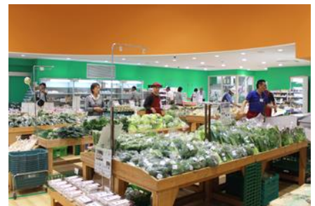
あびこ農産物直売所あびこん