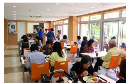
レストラン「旬菜厨房米舞亭」

既存の水環境保全啓発機能も強化されました。水槽やバードカービングで手賀沼に暮らす生き物について学べる手賀沼ステーションや触れる土器で手賀沼の歴史文化を学べる手賀沼学習コーナー、新たにデジタル式の投影機を導入したプラネタリウム、双眼観光望遠鏡が設置された展望室など、手賀沼について楽しく学べる施設が充実しています。さらに、屋外の様々な親水遊具がある水の広場の脇には新たにシャワー室とコインロッカーを設置しました。手賀沼周辺のウォーキングやランニングを楽しむ方や親水広場で遊ぶご家族連れにご好評いただいています。