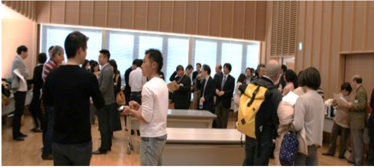
前回のビジネス交流会の様子(H29.2.4)