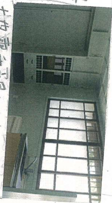
地震重視にしたため、 安室にな、ている。

元は台所だ、た場所 この部屋でも食器 棚を建て付けにする 地震文才策が、 とられていきます。