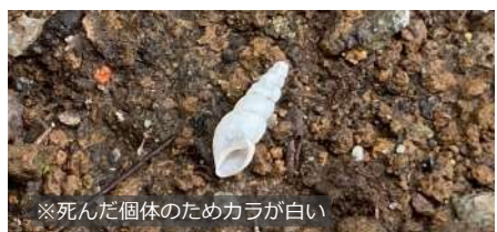
オカチョウジガイのなかま 大きさ：約5~10mm いる場所：地面 特徴：植木鉢や朽木の下にいる