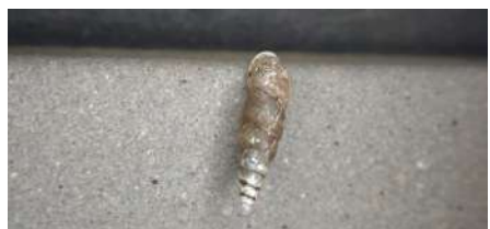
ナミコギセル 大きさ：約5~15mm いる場所：地面~半樹上 特徴：煙管(きせる)に似ていることから命名