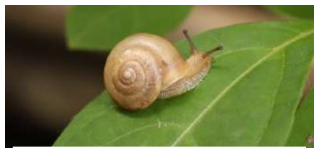
オナジマイマイ 大きさ：約1.5cm いる場所：住宅地・畑 特徴：黄白色のカラ。乾燥に強い