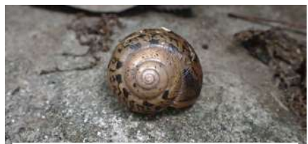
ウスカワマイマイ 大きさ：約1.5~2.0cm いる場所：住宅地など 特徴：カラが丸くブチ模様のことが多い