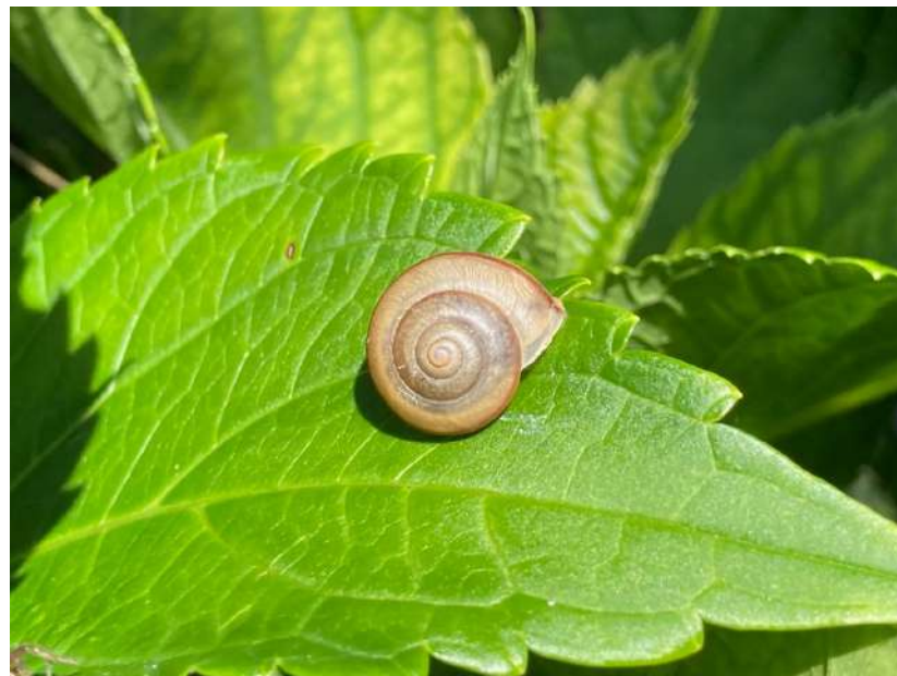
▲アジサイの葉の上で休むオナジマイマイ

梅雨は雨の日が多くカタツムリの観察に適した時期です。童謡の歌詞にでてくる「つのおせ やりおせ 目玉おせ」のツノ・ヤリ・目玉はそれぞれ何を指すものなのか、観察してみましよう。また、身近にみられるカタツムリの種類にも注目して探してみましよう。