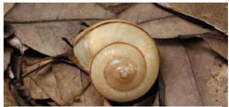
ヒダリマキマイマイ 大きさ：約4cm いる場所：半樹上 特徴：名前の通りカラが左巻き