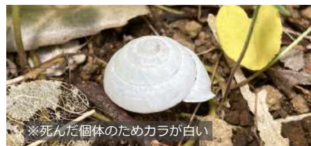
ニッポンマイマイ 大きさ：約1.5~2.0cm いる場所：林縁の草地 特徴：カラを横からみると円錐形