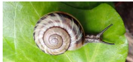
ミスジマイマイ 大きさ：約3~4cm いる場所：半樹上 特徴：三本のスジが入ることが多い