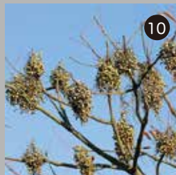
10 ハゼノキの実は水分が少なく脂肪分が多いので、鳥によく食べられる