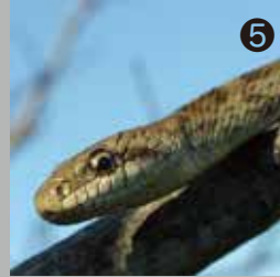
5 エノキの枝を移動していたアオダイショウの幼蛇