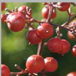
おいしそうに熟したナンテンの実は果実食の鳥たちに人気はあるのかな？