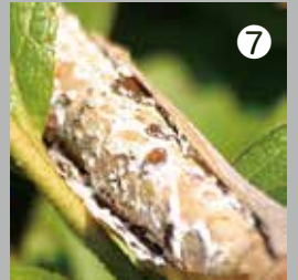
7 ヨシにつくカイガラムシは小鳥たちにとって、餌が少ない冬の貴重な食料になる