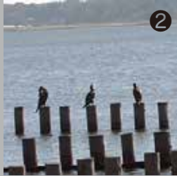
2 杭にとまるカワウの中には繁殖羽の個体もいた