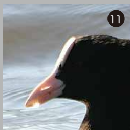
11 切れ込みのような形をしたオオバン