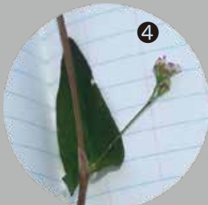
4 アキノウナギツカミ

茎に下向きのトゲがあり、「ウナギも掴める」という意味が名の由来と言われているが、由来にはトゲがちょっと頼りない！？