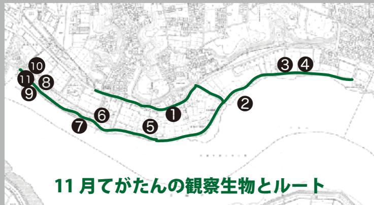
11月てがたんの観察生物とルート

茎に下向きのトゲがあり、「ウナギも掴める」という意味が名の由来と言われているが、由来にはトゲがちょっと頼りない！？