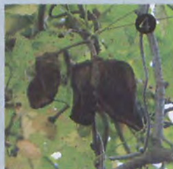
③ 普通の5葉のアカビと違い3葉のミツバアカビ