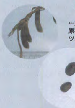
⑥ ←大豆の原種であるツルマメ