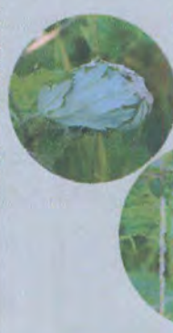
⑦ ←ヨモギの葉の中を開けると...