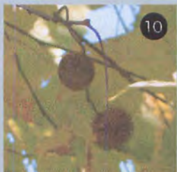
⑨ モミジバフウとともに街路樹の実でよく目立つアメリカスズカケノキ