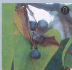
⑪ ヤマノイモのムカゴは食べると粘り気があるおいしい