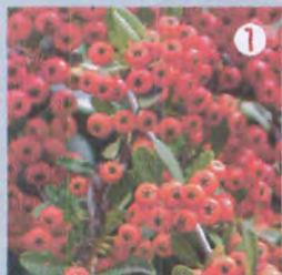
① 晩冬まで残るトキワサンザシの実。本当はまずい??