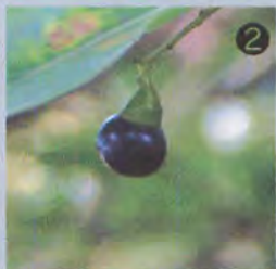
② 樟腦(しょうろう)の匂いがするクスノキの実