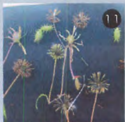
⑧ くつつき虫集め!(コセンダングサ、アメリカセンダングサ、オオオナモミ)