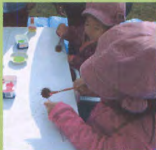
モミジバフウの飾りづくり

ムクロジにはサポニンという成分が含まれていて、石けんとよく似た特性があり、水の膜をつくるので、シャボン玉ができます。石けんが高級品だった頃は、ムクロジの実が洗濯に使われていました。また羽子板の羽にはムクロジの実が使われていたり、昔の人の生活にはなくてはならない木の実だったようです。