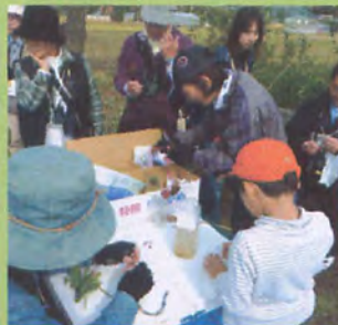
ムクロジの実でシャボン玉