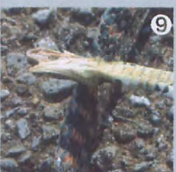
⑩ ヤマカガシの斃死体。赤と黒の斑が目立つへビ