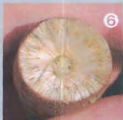
⑤ カマボコの語源であるガマの穂の断面(ヒメガマ)