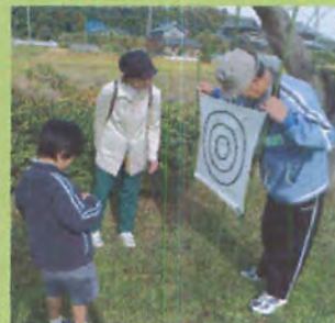
くつつき虫で的当て