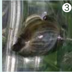
③ 田んぼの水の中にはサカマキガイがいっぱいいました。