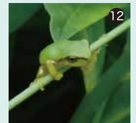
⑫ ちいさなニホンアマガエルがたくさんいました。