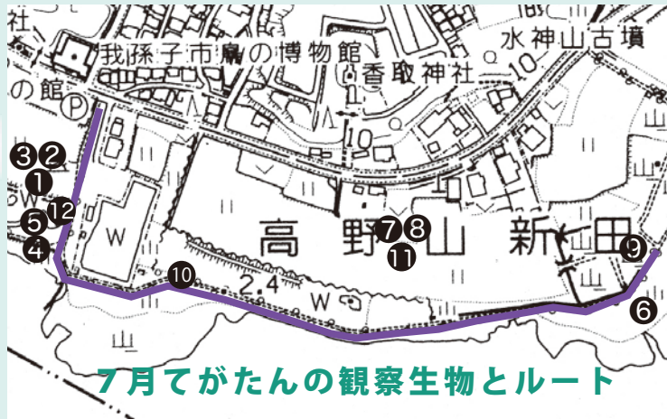
7月てがたんの観察生物とルート