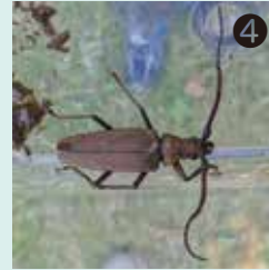
④ ウスバカミキリを見つけました。