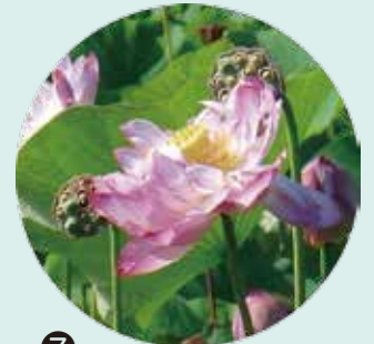
⑦ ハス (藕糸蓮)