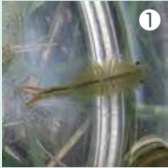
① 田んぼの水の中をよく見るとホウネンエビがいました！