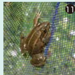
⑪ トウキョウダルマガエルをつかまえました。