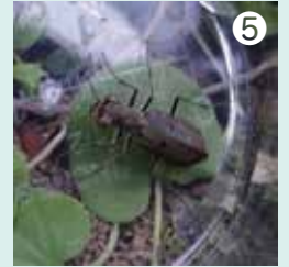
⑤ 草原にはコハンミョウがいました。