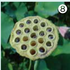
⑧ 「ハチ巣」が名前の由来とされるハスの花托の中には種子がいっぱい。