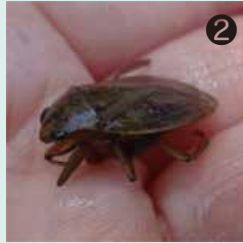
② コオイムシをつかまえました。