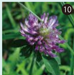
⑩ ムラサキツメクサの花