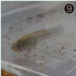
⑨ 用水路でつかまえた魚は「カダヤシ」でした。