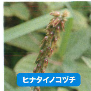
ヒナタイノコヅチ