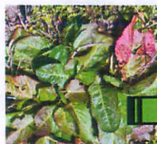
ギシギシの葉を 裏返して見ると...