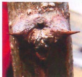
鬼のようにみえる ニセカシアの葉痕

葉痕とは落葉後に茎に残る葉柄基部がついていた部分のことです。葉痕には維管束の配置がはっきり見えたりします。それが色々な形に見えることがあります。葉痕の顔をスケッチしてみよう！