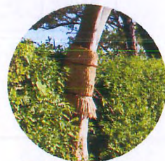
設置されたこも巻き

我孫子市公園緑地課と鳥の博物館では「こも巻き」を利用して、遊歩道沿いで冬越しをする虫の種類や数を調べていました。設置した「こも巻き」にどんな昆虫が隠れているか調べてみよう！