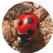
ナナホシテントウ