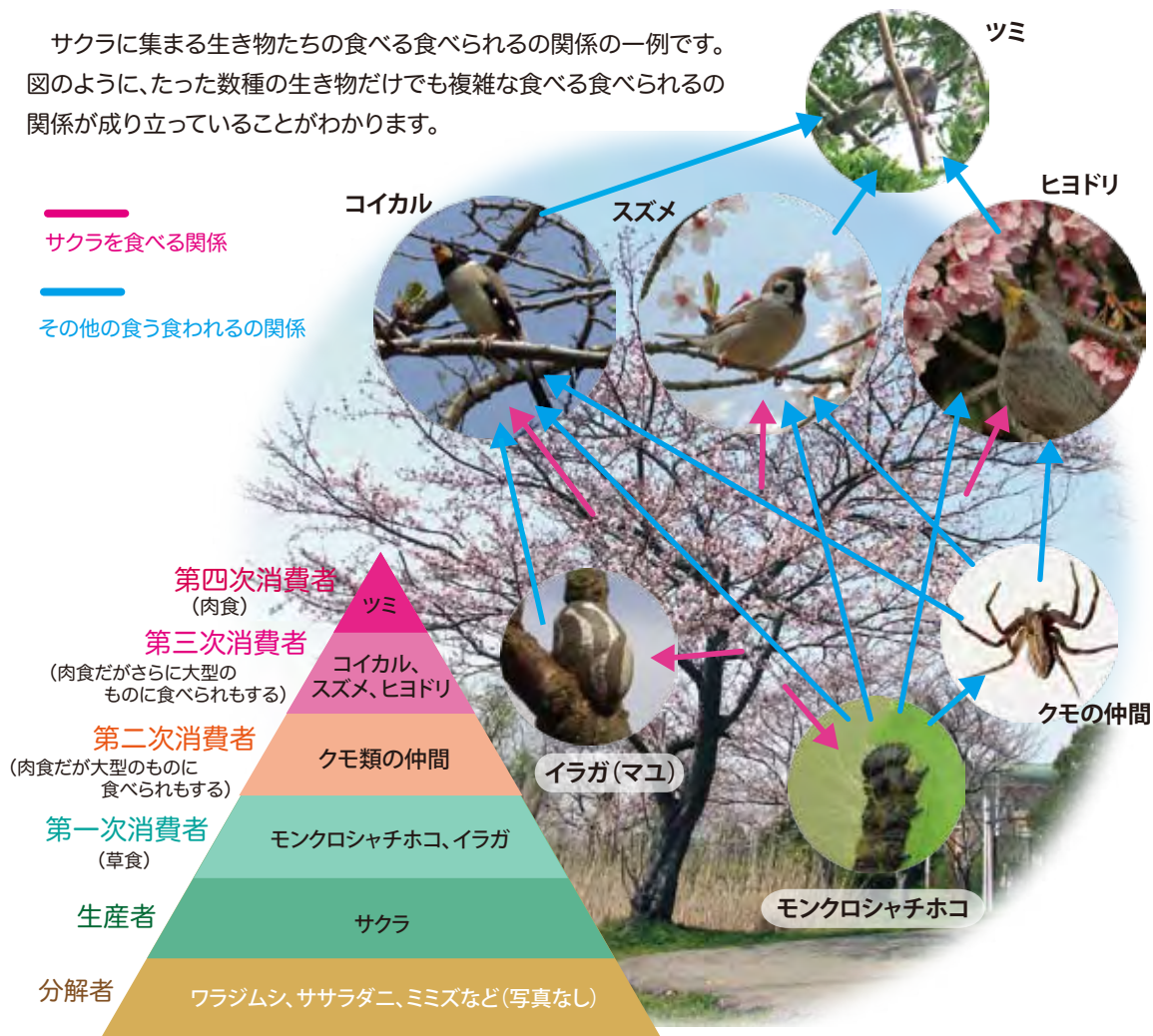
写真の生き物たちを表した生態系ピラミッド