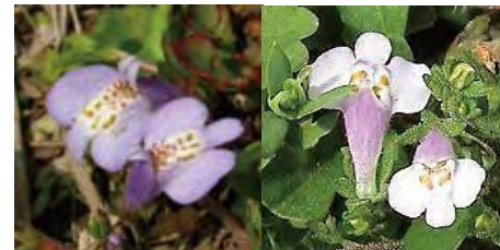
ムラサキサギゴケ