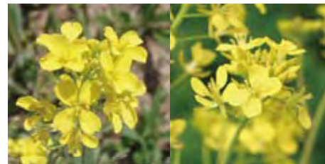
セイヨウアブラナ