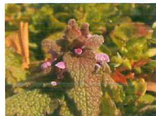
ヒメオドリコソウ