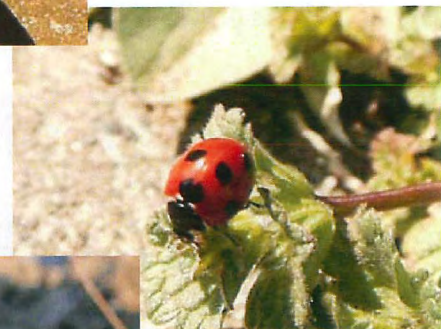
ナナホシテントウ