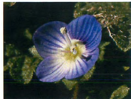
オオイヌノフグリ