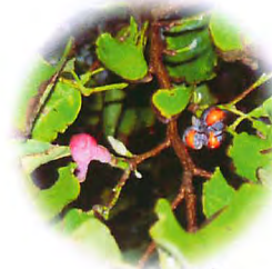
コブシの実 鳥博前 5 Oct. 2004