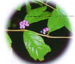
ムラサキシキブの実 鳥博裏 5 Oct. 2004