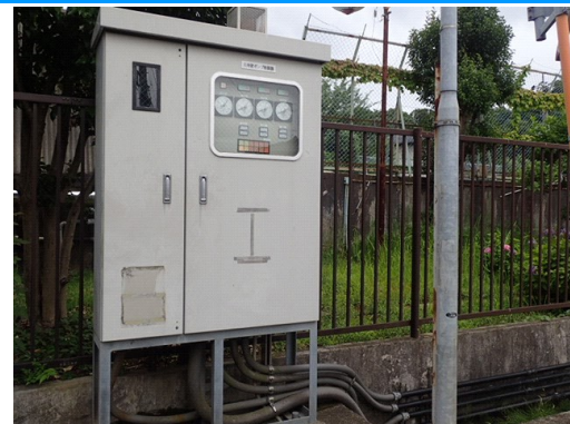
排水ポンプ制御盤（既設）