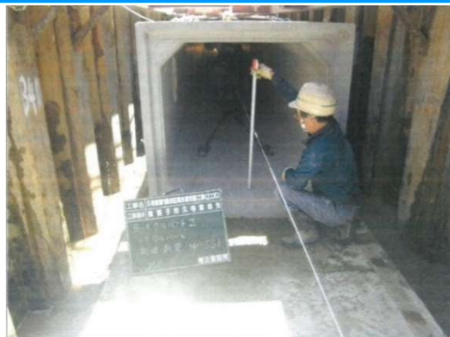
雨水管布設時の状況