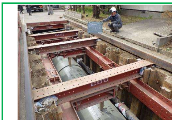
雨水管布設工事の状況