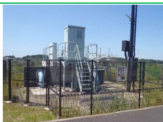
ポンプ場（整備済み）