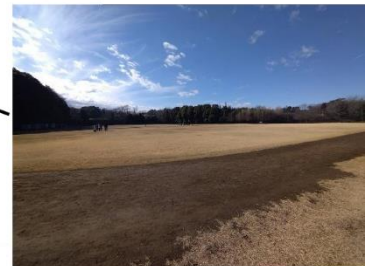
五本松運動広場の現状