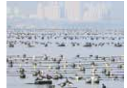
「中国山東省の都市部の海に広がる養殖エリアで越冬するコクガン」