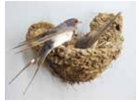
「ツバメの巣のジオラマ」

多くの鳥は抱卵・育雛のために巣を造ります。そこには子孫を残すためだけの工夫があるのでしょうか。私たちは普段、野鳥の巣や卵を見る機会はあまりありませんが、鳥の巣と卵の標本や営巣の様子を再現したジオラマを展示します。