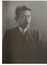
杉村楚人冠

同じ東京朝日新聞社の職員として、楚人冠と啄木は友情を育みました。そんな啄木が楚人冠に宛てた書簡や、両者をめぐる人々の資料を展示して、楚人冠と啄木の関係をご紹介します。