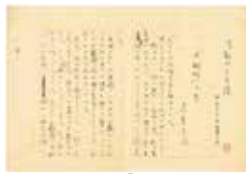
志賀直哉原稿「『木賊洲』と馬」

開館：9:00～16:30 (入館は16:00まで) 休館日：月曜 (祝日の場合は翌平日) 所在地：千葉県我孫子市緑 2-11-8 TEL: 04-7185-2192