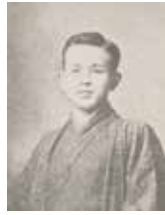
石川啄木