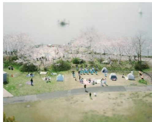
▲手賀沼親水広場（展示予定）

内容：市内小学校の空撮や水の館の展望室から撮影した作品のほか、連続写真を繋げた映像作品も上映