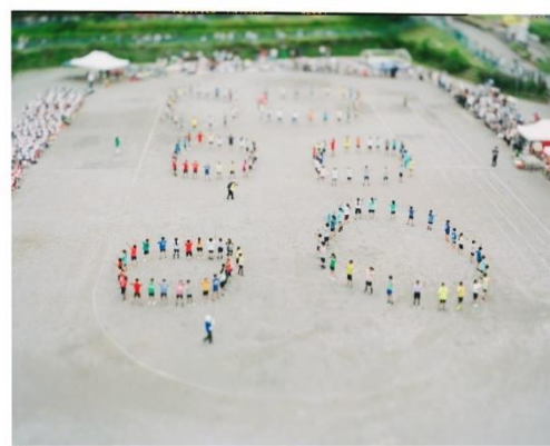
▲我孫子第一小学校の運動会（展示予定）