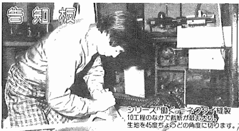
シリーズ「心のつなぎ」縫製工程のなかで職人が最も大切に生地を45度ちよんどの角度に切ります。