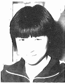
全国中学生「税に関する作文コンクール」第3位

そのままだけに小遣いが多い子供は、生活に密着した話題や今の話題なども盛り込んでいて、構成もよくできて、またとなく読者の心を打つ。物語のメインに説き及ぼす。表現した長次先生は、レポート的に調べたことを、しかもという部分はスケッチで描き加えている。