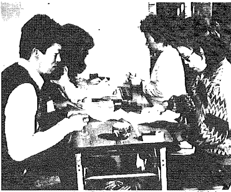
国民年金任意加入者で「現況届」の必要な人はすぐに提出を。提出を忘れると思わぬことにも一つくし野支所での受付