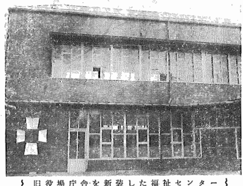
旧役場庁舎を新装した福祉センター