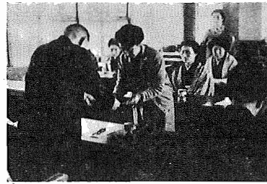
(母子福祉推進委員へ委嘱状、2月4日)

幼い子どもをかかえて、しかも夫と死別、あるいは離別した母親が生活している。母子家庭では、一家の経済的・精神的支柱とならねばならぬ母が経済的に弱く、その生活が著しく不安定な状態に追い込まれる可能性が大きい。そこで町では、母子福祉推進委員を、母子福祉推進委員に、母子福祉推進委員の身の相談や母子福祉資金借入れなどについての相談は地域の委員までお願いしたい。