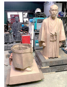
▲鋳造直後、上下半身溶接前

今回制作された像は、これまでに同じ原型で銅像が6体(うち1体は太平洋戦争中に供出されて現存せず)作られ、いずれも嘉納ゆかりの地である筑波大学東京キャンパス、講道館、筑波大学、灘高校、台東区朝倉彫塑館にある。