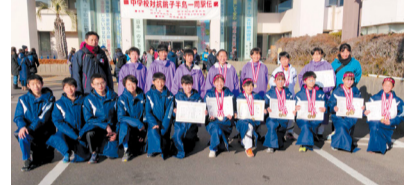
▲女子の部優勝の白山中学校