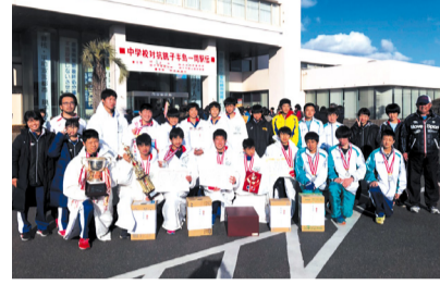
▲準優勝の我孫子中学校

男女混合の部で我孫子中学校Aが準優勝、白山中学校が6位入賞、女子の部で白山中学校が優勝、湖北中学校が5位入賞しました。