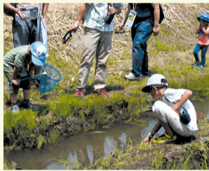
▲てがたんでの観察風景

期間 2月2日(土)~6月16日(日) 場所 鳥の博物館2階企画展示室 内容 「てがたん」は、鳥の博物館の前に広がる手賀沼沿いにくらす生き物を観察する散歩感覚の観察会です。今回の企画展では、これまで観察した生き物たちを振り返り、自然観察の楽しさを紹介します。 費用 無料(要入館料)