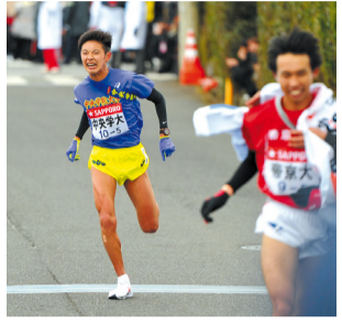
▲往路10位でフィニッシュ 5区高砂選手