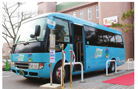
▲新たな路線バス「アイバス」