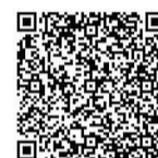
▲ちば電子申請サービス

所・■・☎ 〒270-1132湖北台1の12の16健康づくり支援課(保健センター) ☎7185-1126