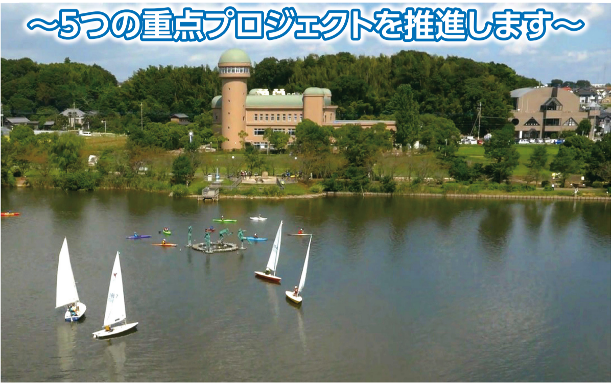
～5つの重点プロジェクトを推進します～

新クリーンセンターの整備 *34年度末の稼働を目指し、環境影響調査や土壌汚染状況調査、リサイクルセンターを進めます。