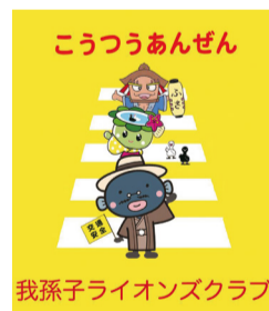
図 教育委員会学校教育課 ☎7185-1267