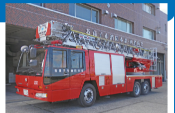
▲はしご付き消防自動車

◎経年劣化した西消防署のはしご付き消防自動車と、つくし野分署の高規格救急自動車を購入します。また、救命率向上のため、24時間営業のコンビニエンスストアへのAED設置に向けた取り組みを進めます… 2億4303万円