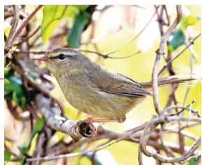
▲谷津田に春を告げるウグイス

定員 先着30人(要申込)※小学4年生以下は保護者同伴 費用 100円(資料・保険料)※中学生以下は無料 持ち物 歩きやすい靴と服装、帽子、双眼鏡(お持ちの方) 申・問 鳥の博物館 ☎7185-2212