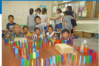
▲第三小学校あびっ子クラブ

◎保育事業の健全な運営と待機児童ゼロを維持するため、認定こども園へ移行する私立幼稚園・保育園の運営を支援します… 2億5935万円