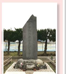
▲手賀沼殉難教育者の碑