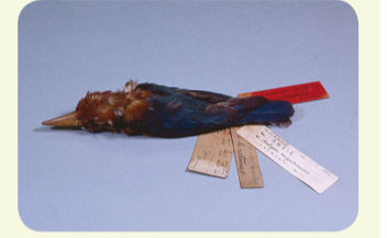
▲山階鳥類研究所に保存されているミヤコショウビンの標本