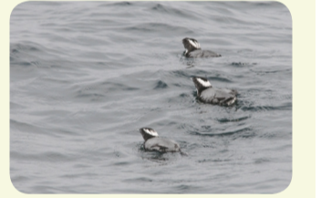
▲海上を泳ぐカムリウミスズメ