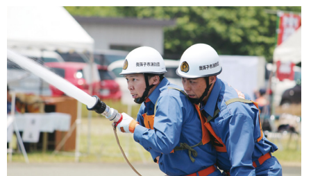
▲小型ポンプの部 優勝 第14分団