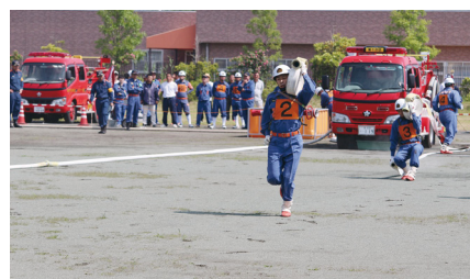
▲ポンプ自動車の部 優勝 第1分団