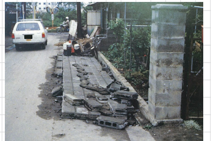
▲控壁がなく道路へ倒壊した塀