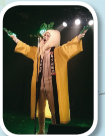
▲カブの妖精「カブ左衛門」