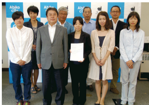
市長と子ども・子育て会議委員