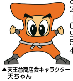
▲天王台商店会キャラクター 天ちゃん

昼から夜まで楽しめるおまつりです。ステージ出演や出店など、地域全体で盛り上げます！ 場所 天王台西公園(JR天王台駅南口徒歩3分) 内容 ◎ステージ 正午～開会式、午後0時40分～4時吹奏楽・軽音楽・和太鼓演奏、ソーラン、ダンスほか、午後4時40分～賞品盛りだくさん！ビンゴゲーム大会 ◎公園広場午後7時