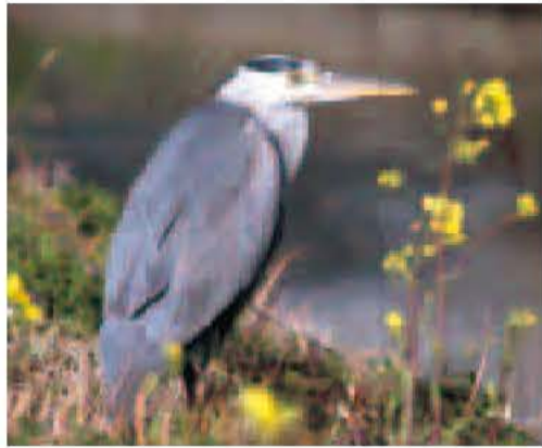
文 斉藤 安行 (鳥の博物館学芸員)