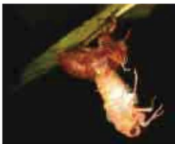
▲アブラゼミの羽化