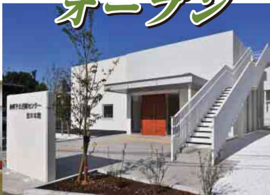
▲並木本館(並木5の4の6)

休館日 毎月第1・第3水曜日 年末年始(12月29日~1月4日) 施設概要・使用料 左表参照 開館前の利用申し込み 8月3日(火)~10月3日(日)の利用申し込みは、7月27日(火)午前9時30分~10時。我孫子北近隣センター1並木本館で受け付け 開館後の利用申し込み 利用予定日の2カ月前の同日(休館日の場合は翌日)の午前9時~9時55分