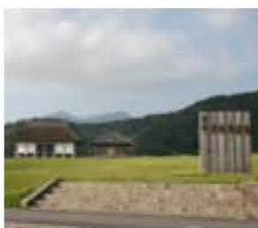
▲スタート地点の一つ 平沢官衙遺跡

1回目…7月3日(日) (午前10時・場所は未定) 2回目…7月17日(日) (午前10時・場所は未定) 3回目(体験発表)…10月8日(土)午後1時、アビスタ