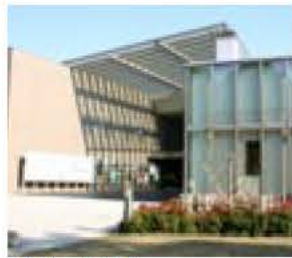
▲ゴール地点 アビスタ正面玄関