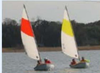
▲指導員が親切に指導します

「Enjoy手賀沼」は、一人ひとりが手賀沼とのかかわりを考えながら、楽しい一日を過ごそうというイベントです。