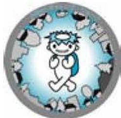
▲シンボルマーク「チャレ」くん