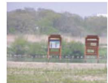
▲鳥を観察する「ハイド」も完成

利根川ゆうゆう公園内のピオトープの園路が整備されました。ピオトープには、さまざまな動物が生息し、自然豊かな環境が作り出されています。