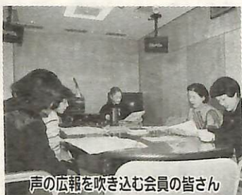
声の広報を吹き込む会員の皆さん