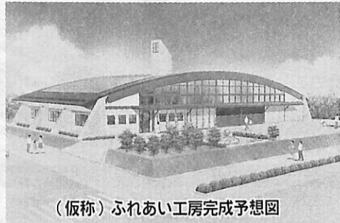
(仮称)ふれあい工房完成予想図