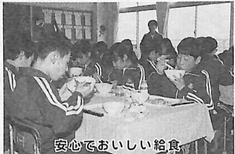
安心でおいしい給食

II前ページからII ◎古利根沼周辺保全対策(610万円) 古利根沼周辺緑地の一部を、(仮称)古利根の森とするための基本設計を行い、整備に着手します。 ◎(仮称)ふれあい工房建設