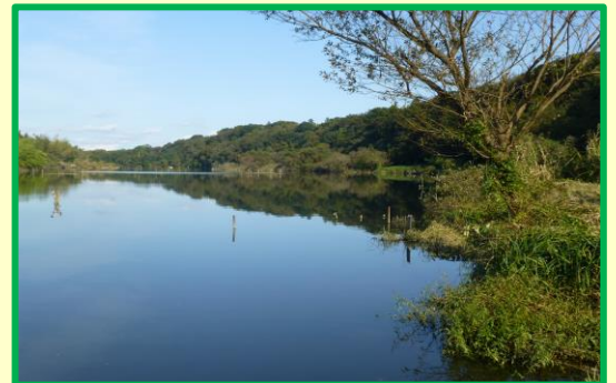
湖北エリア 古利根沼