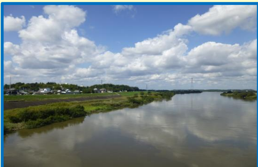
布佐・新木エリア 利根川