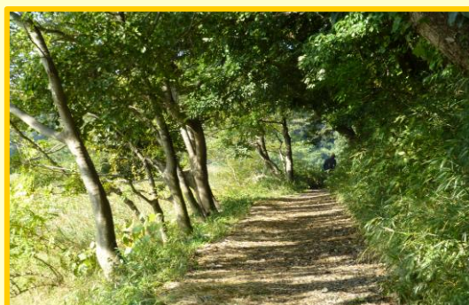
天王台・東我孫子エリア 岡発戸都部の谷津