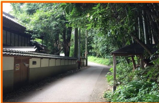
我孫子エリア 築地堀とハケの道