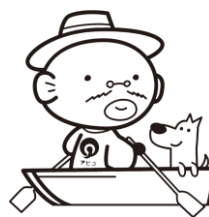
我孫子市マスコットキャラクター 手賀沼のうなぎちゃん

ご利用の施設により利用時間が異なります。 また、時期や状況により閉鎖している場合があります。 お出かけ前にホームページ・電話 等でご確認ください。