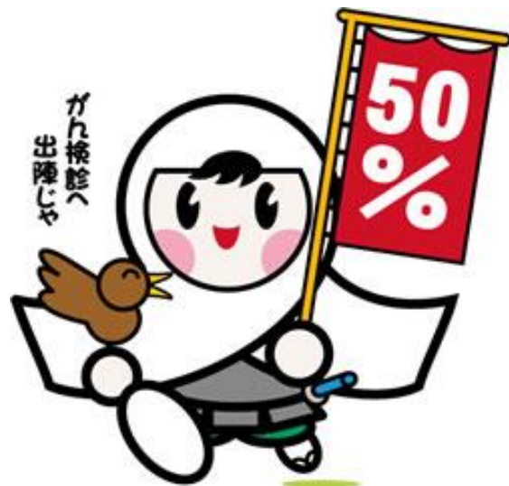
がん検診受診率50%達成に向けたロゴマーク 厚生労働省

日本人の2人に1人が「がん」になります。 早期に見つければ、「がん」は治すことが可能です。