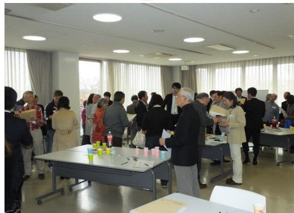
前回のビジネス交流会の様子(H28.2.13)