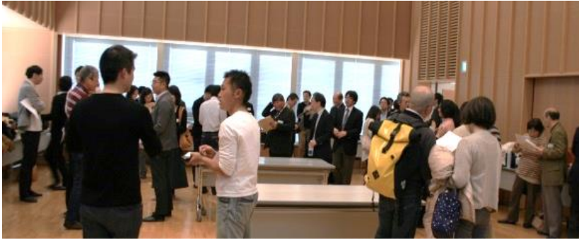
ビジネス交流会の様子(H29.2.4)