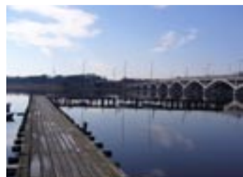
▲我孫子手賀沼漁業協同組合棧橋

住所、親子の氏名、電話番号、返信あて先(裏面は未記入)を明記し、3月3日必着で〒270-1192市役所手賀沼課(クリーン手賀沼推進協議会事務局)〈住所省略課〉へ郵送 手賀沼課・内線467