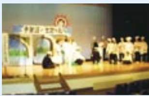
▲昨年の寸劇の様子

日時 2月17日(日)午前9時30分から午後3時30分 場所 湖北地区公民館 内容 各学年の寸劇・クラブ・同窓生の発表と作品展示 入場料 無料 ※駐車場は限りがあります。公共交通機関をご利用ください。 問い合わせ 湖北地区公民館 ☎7188-4433