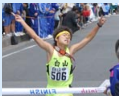
▲つないだ力 みごと開花

10月13日、秋の晴れ間が時折顔をのぞかせる絶好の駅伝日よりのなか、第61回東葛駅伝が開催されました。