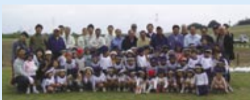
▲ロータリークラブと白ばら幼稚園のみなさん

レンゲの種と肥料は、我孫子ロータリークラブからご寄付をいただき、種まきはロータリークラブメ