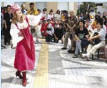
▲鮮やかな衣装と軽やかなダンスを披露

8月3・4・5日、けやきプラザ開館1周年を記念したイベントがけやきプラザなどで行われました。同プラザは、市民活動や福祉、コミュニティ、文化活動などの拠点施設として昨年8月にオープン。1年間で約25万人が訪れました。当日は、大人も子どもも楽しめるさまざまなイベントが行われ、オープニングでは、ロシアダンス(写真)などが行われ祭りに華を添えました。