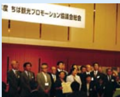
▲県知事から特別功労賞を受賞

ちばDC市地域実行委員会は、7月19日に開催された県のちばDCの報告会で、市民や商業者、運輸業者などさまざまな分野の方々が協力して観光事業に取り組んだことが千葉県から評価され、特別功労賞を受賞しました。同委員会は、DC期間中(平成19年2月~4月)、「あびこがおもしろい!」をキャッチフレーズに7つの企画を実施し、期間中は約2万1000人が市内の各施設などを訪れました。