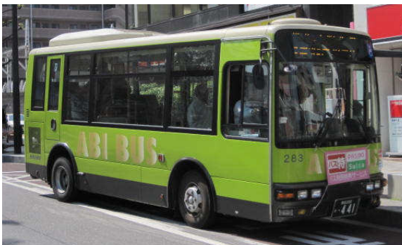
運行車両イメージ