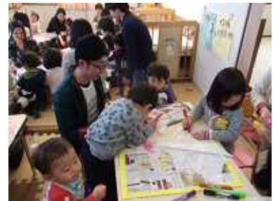
うまく描けたかな?!

風の強い日でしたが、元気に走り回り、お父さんお母さんと一緒に楽しい時間を過ごしました。